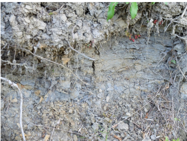
Marne argileuse (Toarcien moyen)