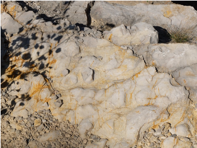
Stromatolithes (constructions fossiles attribuées à des cyanobactéries)

D'autres domaines de la géologie ont également été abordés : paléontologie, tectonique.