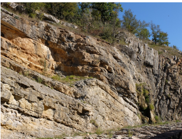
La faille de Siran