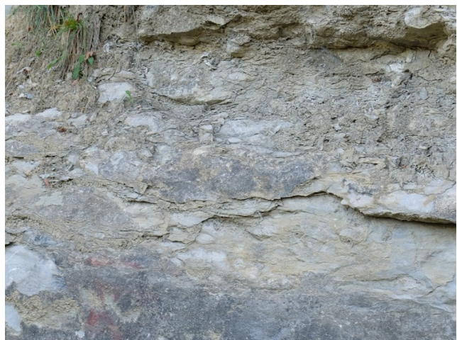
Calcaires argileux (Aalénien)