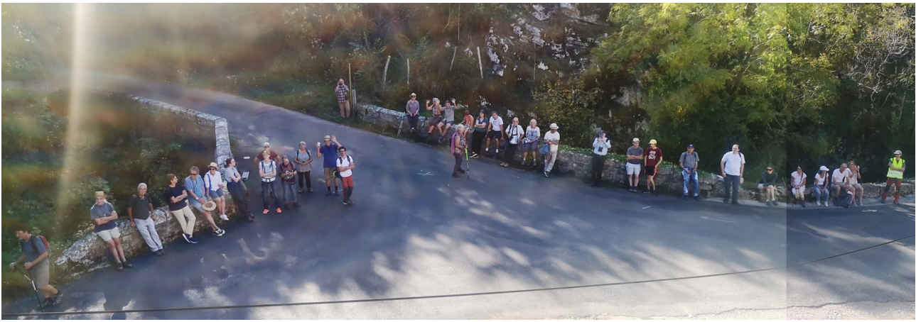
Le groupe vu par l'animateur