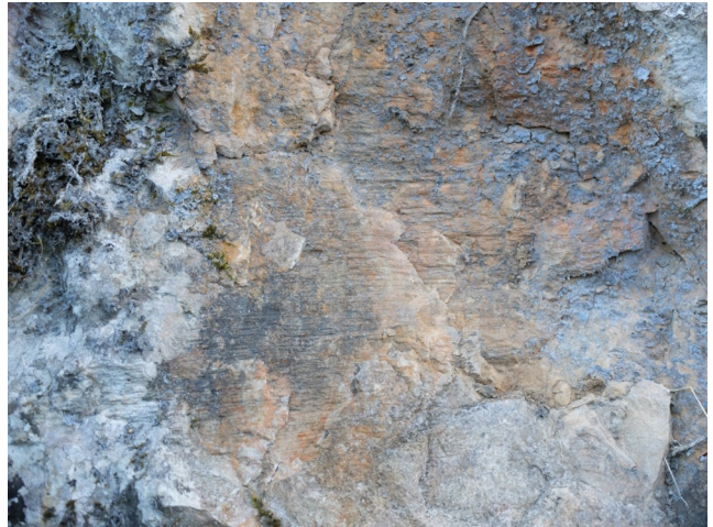
Stries d'origine tectonique