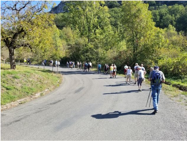
En route !