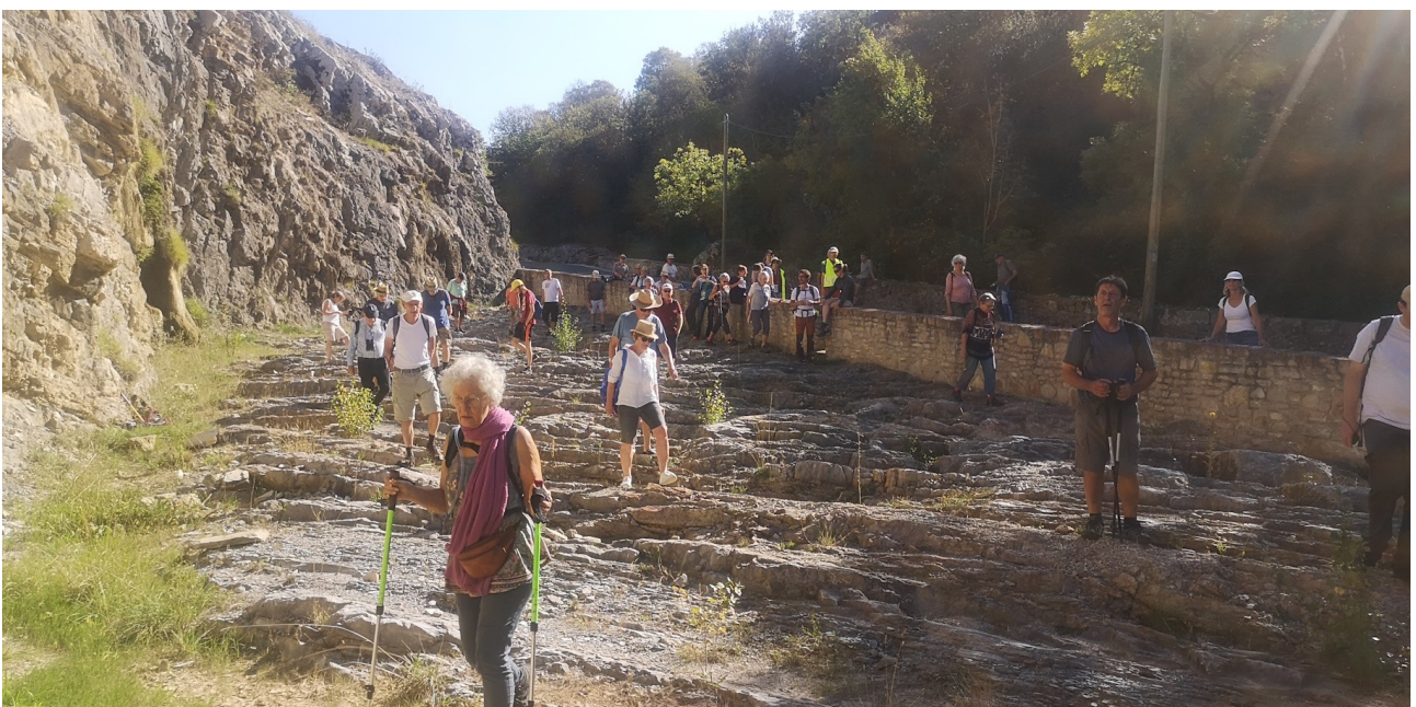
Marcher sur une charnière synclinale, peu courant !