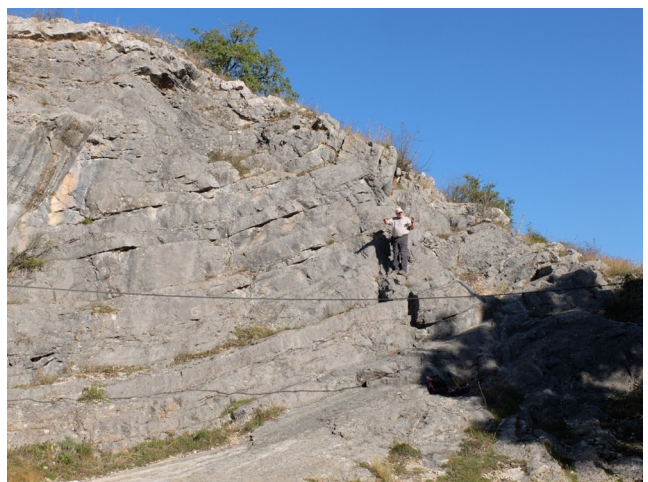
La faille de Padirac

Cette excursion très réussie était de nature à donner le goût de la géologie à certaines personnes ; l'avenir nous dira peut-être si cela a été le cas.