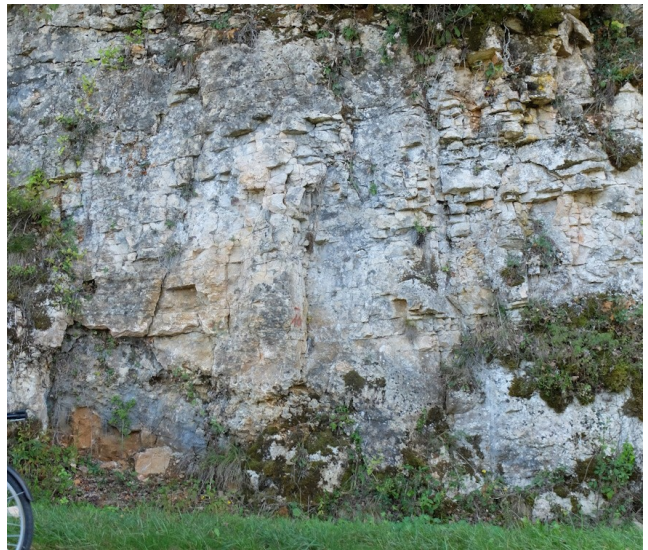
Calcaires oolithiques (Bajocien)

D'autres domaines de la géologie ont également été abordés : paléontologie, tectonique.