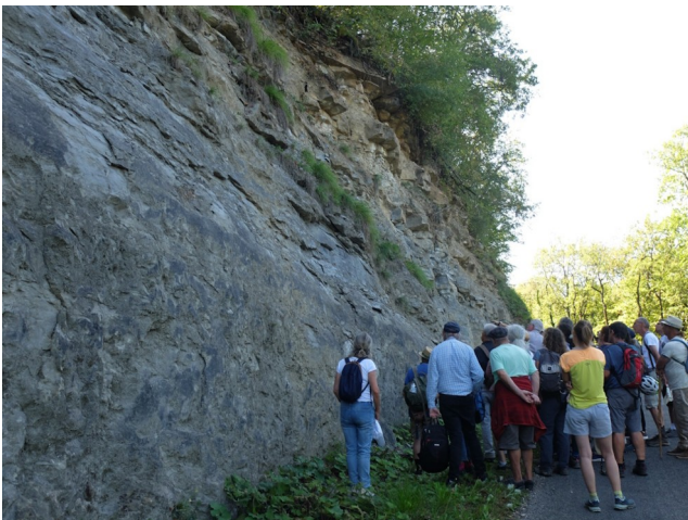
Attroupement déclaré en Préfecture