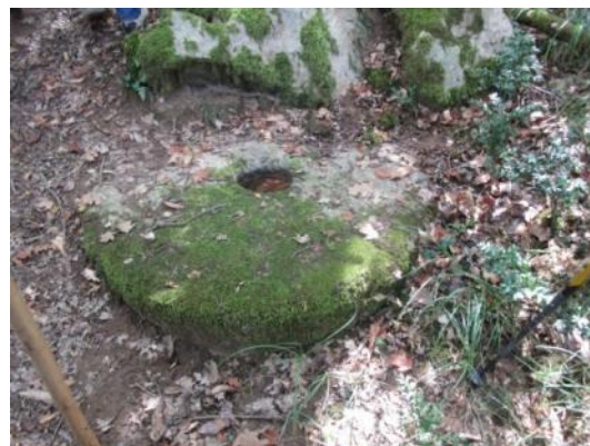
Meule de grès non extraite