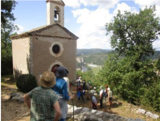
Chapelle Ste Croix

Après avoir atteint le sommet, nous descendons vers St Cirq Lapopie et par les rues étroites nous arrivons à l'office de tourisme.