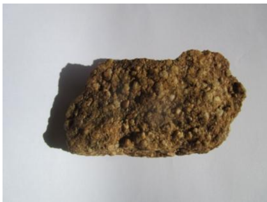
Morceau de grès quartzitique

Ici la végétation change : il y a du châtaignier ! On ne trouve plus de calcaire mais du grès.