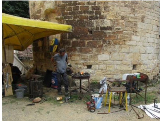
La petite forge