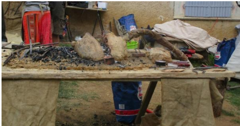
La forge à soufflets à mains