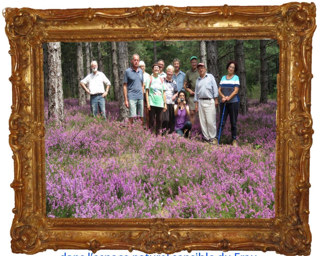
dans l'espace naturel sensible du Frau